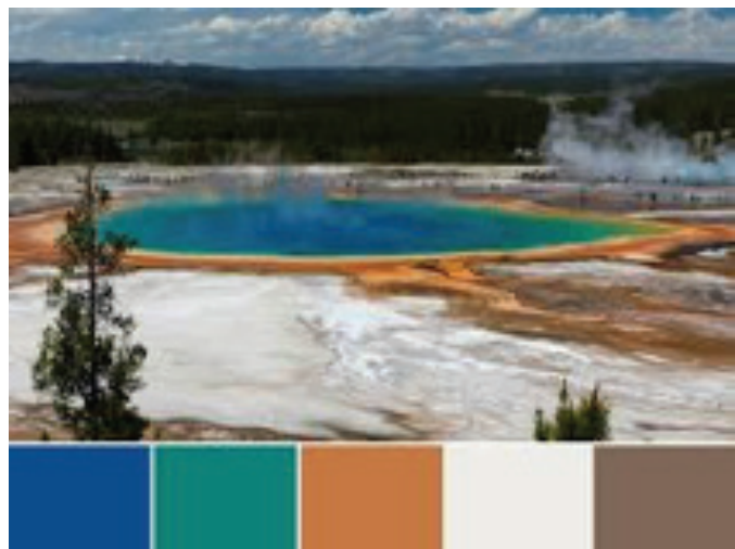
Paleta del Parque Nacional Yellowstone

LISTO Lápiz de grafito, lápices de colores, cuaderno de arte o una hoja de papel en blanco, portapapeles o un libro.