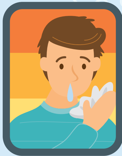
Nariz que moquea