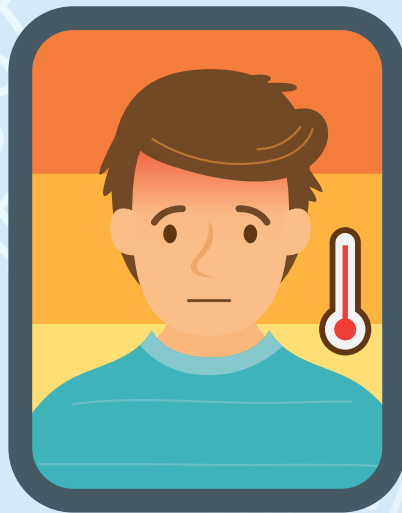
Fiebre y dolor de cabeza