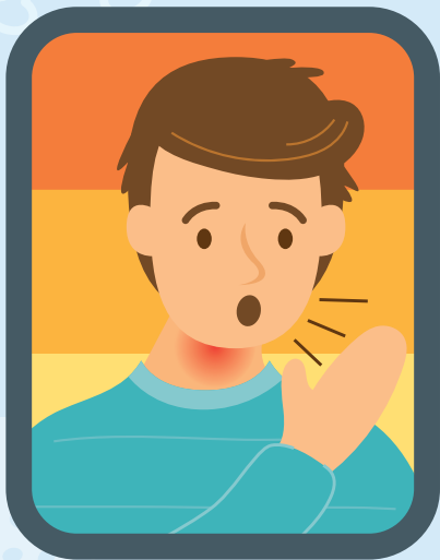
Tos seca y dolor de garganta