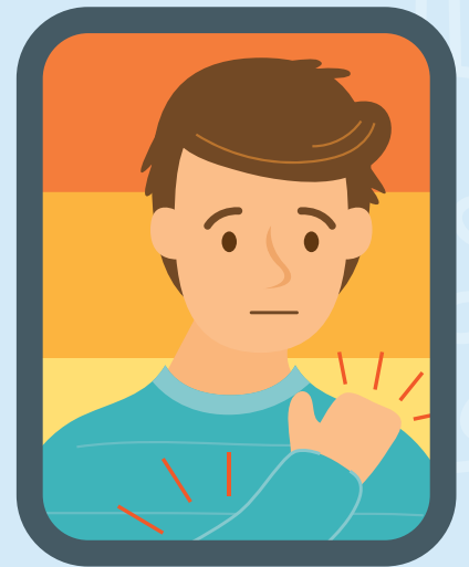
Dolor en el pecho y dolor muscular